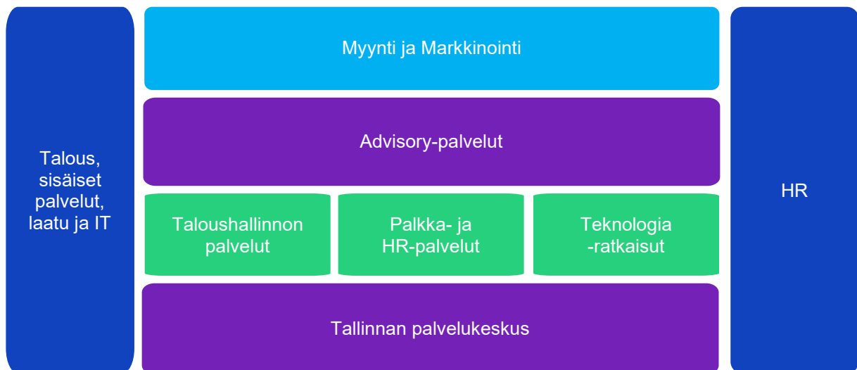
Kuva: Azets Suomen organisaatiokaavio

Azets Insight Oy:n toiminta on jaettu liiketoimintayksiköihin ja liiketoimintaa tukeviin palveluihin. Tarjo- amme taloushallinto-, palkka- ja HR-palveluita, teknologiaratkaisuja sekä tuemme asiakkaita liiketoi- minnan kehittämisessä Advisory-palveluiden avulla.